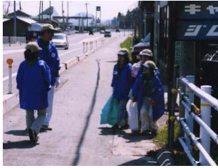
◆朝日村緑の少年団