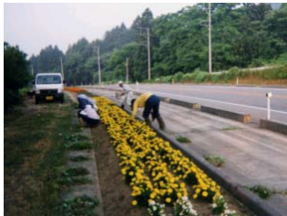
◆鵜渡路老人クラブ

平成8年から9年間にわたり、一般国道7号胎内市(旧中条町)大川町～中条地先の地下横断歩道の清掃を実施されています。