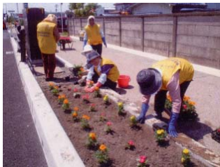
◆白根楽友会 GBクラブ