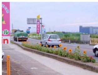
◆ヤマダ自動車販売(株)