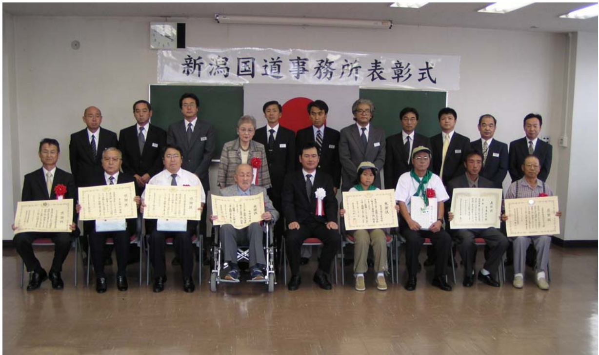
表彰式で撮影した記念写真

さて、国土交通省では、永年道路愛護に取り組み、その功績が顕著であった団体・個人に対して、毎年「道路愛護団体表彰」を行っています。今年度も新潟国道事務所管内で活動する10団体(うち個人2名)が、国土交通大臣表彰等に輝き、今年8月29日(月)に表彰式が行われました。