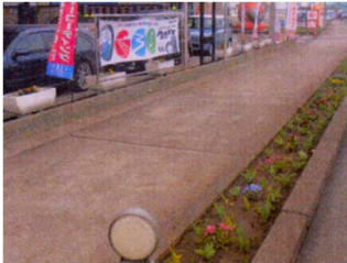
◆(株)川崎商会 新発田中央給油所