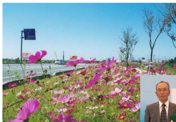
阿賀野市のコスモスロード

今年4月、「みどりの愛護」のつどい(会場:大阪府高槻市 淀川河川公園)において、阿賀野市で活動している「コスモスロードを育てる会」と「上黒瀬コスモスロードを育てる会」が、全国の公園緑地・道路・河川等のみどりの愛護団体、地域の緑化・緑の保全活動団体の中で、顕著な功績のあった団体に対して贈られる「みどりの愛護」功労者 国土交通大臣表彰を受けられました。おめでとうございます。