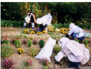
◆朝日村婦人倶楽部

平成13年から4年間にわたり、一般国道7号朝日村宮ノ下～下中島地先において、植栽帯の植栽及び維持管理を実施されています。