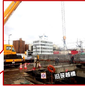
旧笹越橋の撤去状況