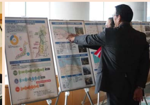
整備効果を説明するパネル展示