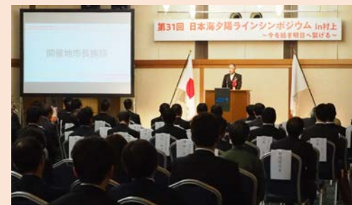
シンポジウムの様子 (会場：夕映えの宿 汐美荘 潮騒の間)