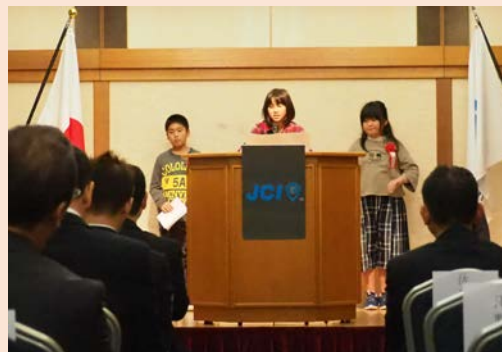
村上市立朝日さくら小学校による現場見学会の報告