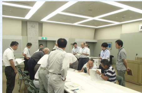
当日の様子(猿沢地区)