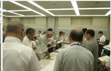
当日の様子(塩野町地区)