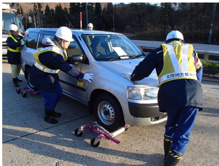
災害対策基本法に基づいた車両移動訓練の様子