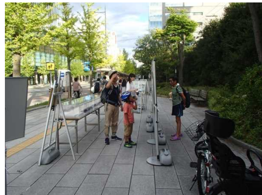
《新潟国道事務所 展示ブース》

萬代橋誕生祭の詳細は新潟市ホームページまで https://www.city.niigata.lg.jp/chuo/event/kanko/2017tanjyousai.html