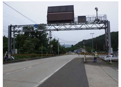
昨年の訓練の様子 (津川除雪ST)