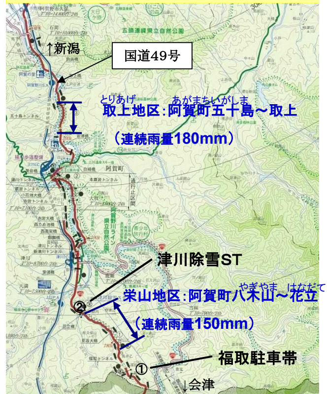
交通遮断機操作訓練箇所 ①福取駐車帯 ②津川除雪ST