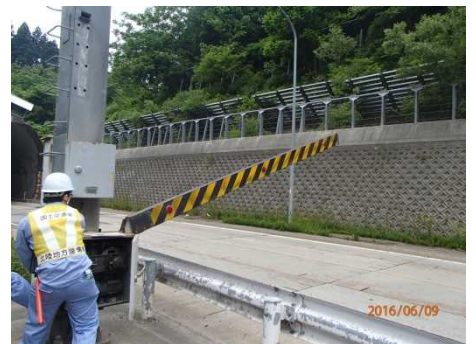
昨年の訓練の様子 (福取駐車帯)