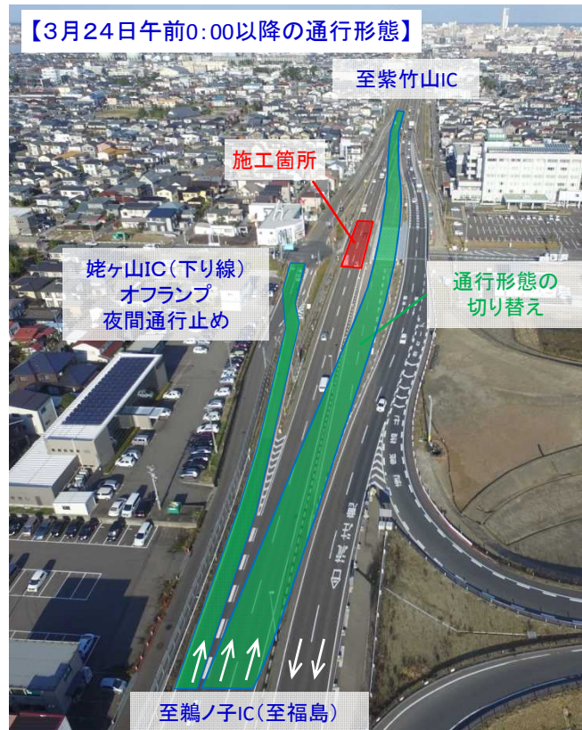
【3月24日午前0:00以降の通行形態】