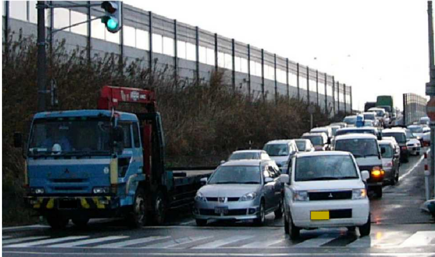
上り線オフランプ