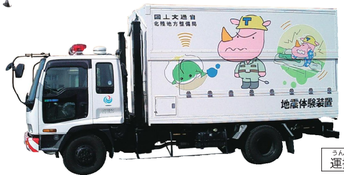
うんぼんじ 運搬時