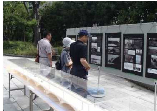
萬代橋模型・歴史パネル展示

萬代橋誕生祭の詳細は新潟市ホームページまで http://www.city.niigata.lg.jp/chuo/event/kanko/2016tanjyousai.html