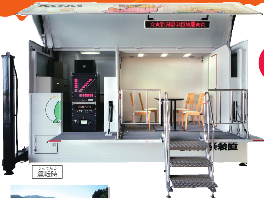
うんてんじ 運転時

災害の恐ろしさ、被害に対する備えを学習するため、実際の地震に近い揺れを体験する装置です。