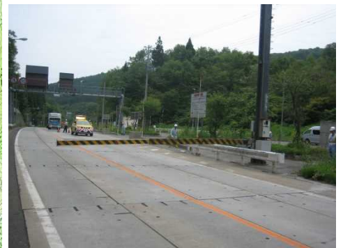
昨年の訓練の様子 (福取駐車帯)