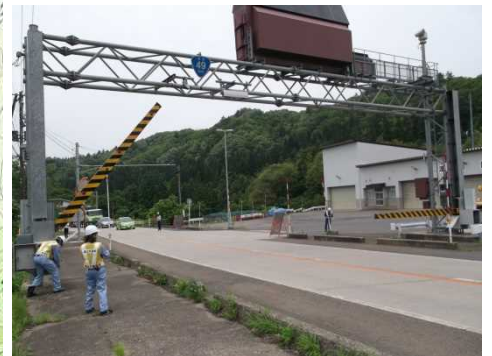
昨年の訓練の様子 (津川除雪ST)