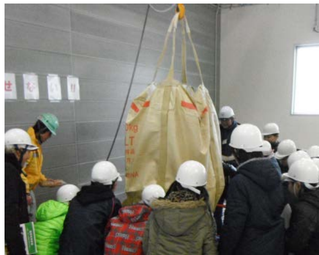
凍結防止剤投入の見学