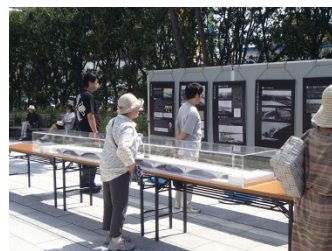
萬代橋模型・歴史パネル展示

萬代橋誕生祭の詳細は新潟市ホームページまで http://www.city.niigata.lg.jp/chuo/event/kanko/2015bandaibashi.html