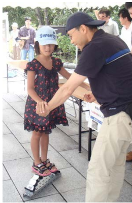
アーチ橋体験模型