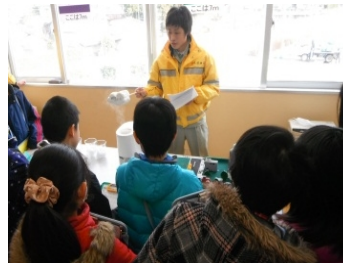
(凍結防止剤の実験)