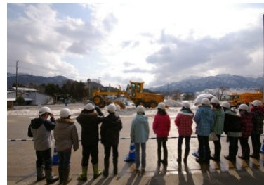
(除雪車デモンストレーション)