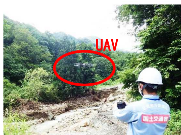
職員によるUAV(ドローン)飛行