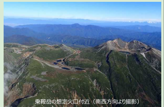
乗鞍岳の想定火口付近(南西方向より撮影)

乗鞍岳火山噴火緊急減災対策砂防計画は、いつどこで起こるか想定が難しい、乗鞍岳の噴火に伴い発生する土砂災害に対して、ハード対策とソフト対策からなる緊急対策を迅速かつ効果的に実施し、被害をできる限り軽減(減災)することにより、安心して安全な地域づくりに寄与するものである。