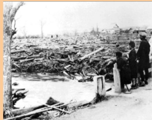
1926年十勝岳噴火に伴った融雪型火山泥流の跡

噴火に伴う高温の噴出物が、積雪を急速に解かし、それによって発生した大量の水が周辺の土砂をまき込みながら流下する現象。