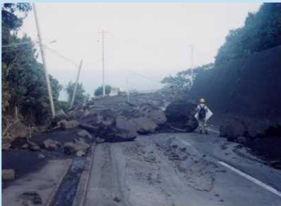
三宅島2000年噴火後に発生した土石流