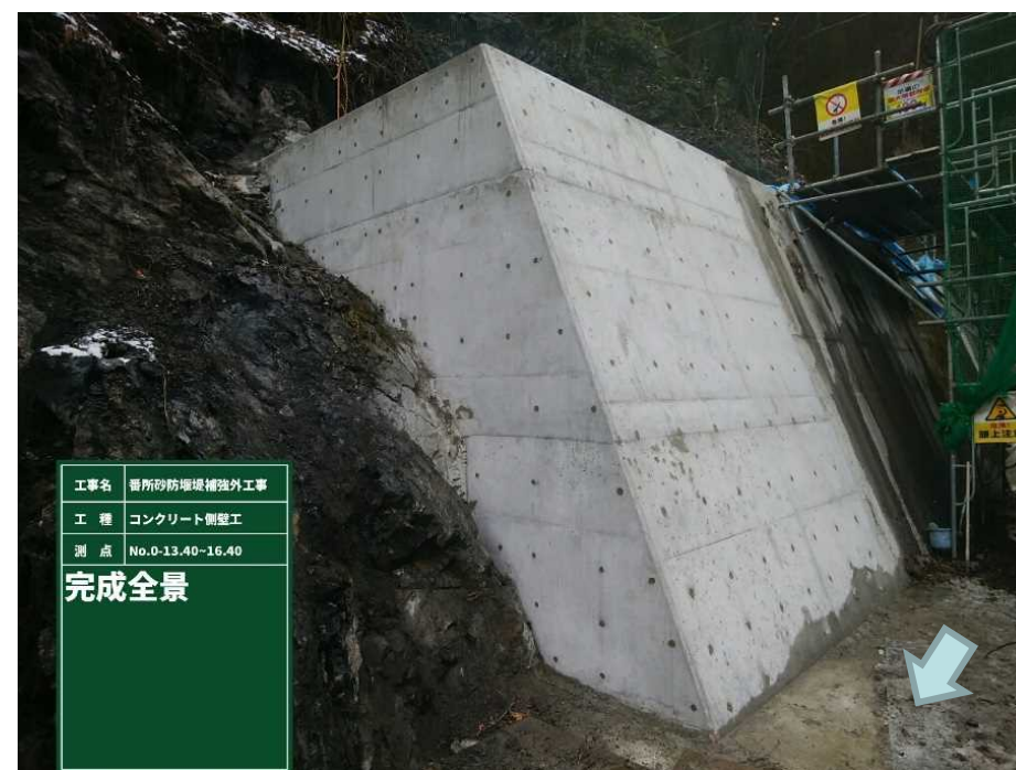
コンクリート側壁工完成全景