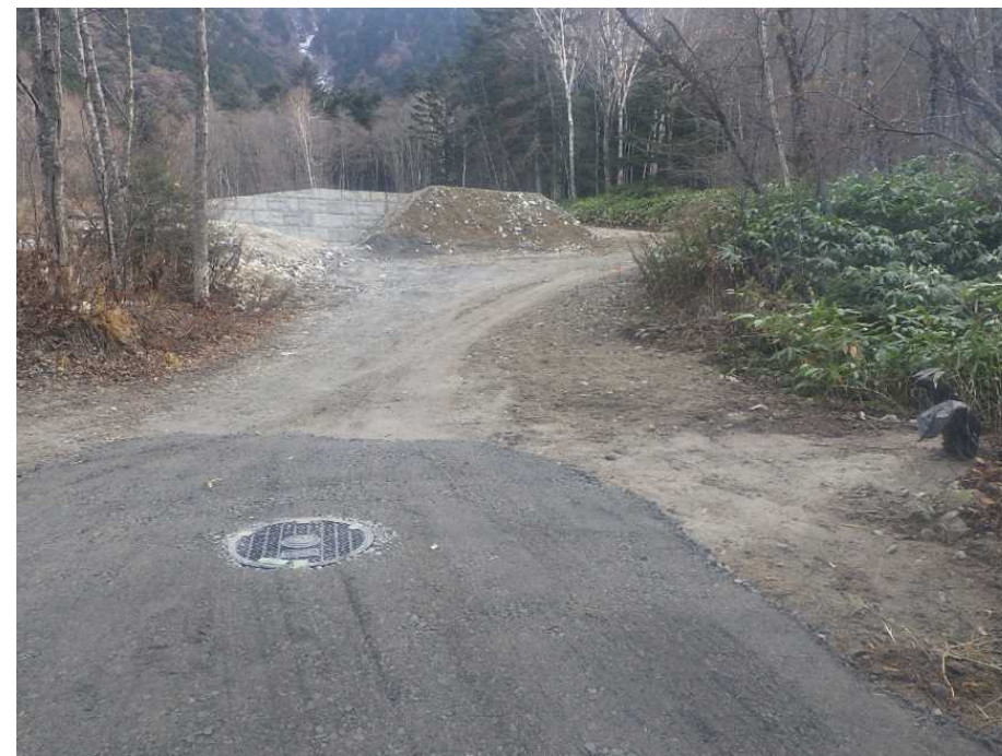
光管路の起点から上流側を望む (新設HH2)