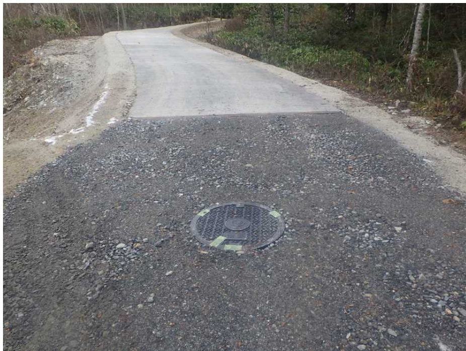
舗装工の起点から上流側を望む (新設HH3)