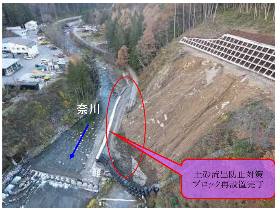
法面現場状況(下流上空より)