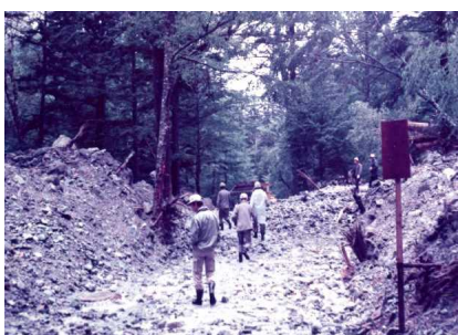
昭和50年7月、県道への土砂流出 (八右衛門沢付近)