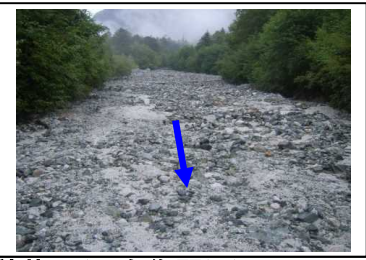
平成20年8月の土砂堆積状況(八右衛門沢)