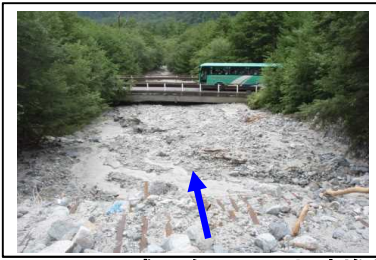
平成20年8月の土砂堆積状況(八右衛門沢)