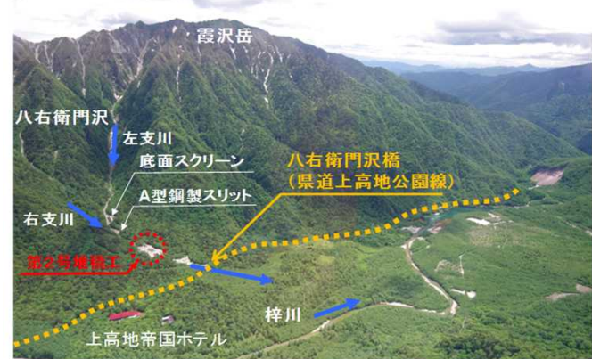
宿泊施設や県道上高地公園線等を守る堆積工