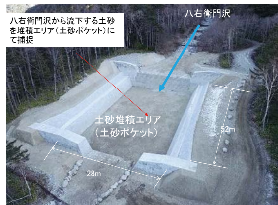
完成した八右衛門沢第2号堆積工の全景

構成されており、構造物の高さを抑えるため掘り込み形式により堆砂容量を確保している。これらの工夫により、必要な土砂捕捉機能を有するとともに、観光客等からの視点場である県道から視認しにくい高さに抑え、さらには除石作業を容易にすることに繋がった。