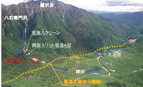
山岳景勝地「上高地」に位置する八右衛門沢

八右衛門沢堆積工が位置する上高地は中部山岳国立公園の特別保護地区にされているほか、文化財としての価値から文化財保護法により特別名勝及び特別天然記念物に指定されており、北アルプスの山並みと清流梓川がつくり出す独自の景観を有する山岳景勝地である。一方で土砂生産・流出の活発な地域であり、支川からの土砂流出は幾度となく県道上高地公園線を寸断させ、観光客が孤立化するなどの被害を及ぼしていた。これらの解消を目的に、八右衛門沢からの流出土砂を捕捉することで保全対象の被害を軽減させることを目的とする堆積工を完成させた。