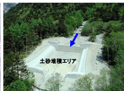
八右衛門沢第2号堆積工の全景 (八右衛門沢付近)