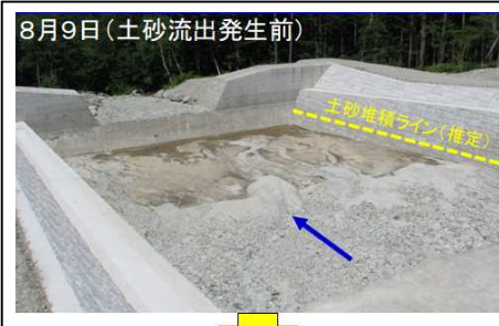
8月9日(土砂流出発生前)