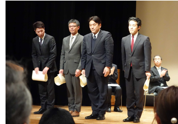
右より松本砂防事務所(所有者)、応用地質株式会社(設計者)、川瀬建設株式会社並びにサワード建設株式会社(施工者)