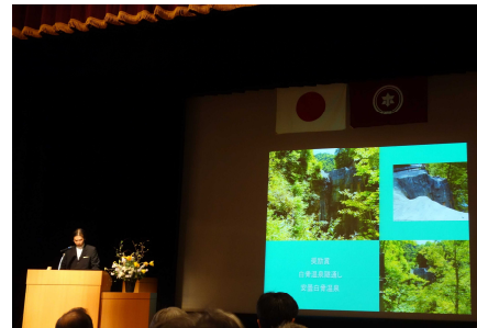
石井実行委員会長による講評