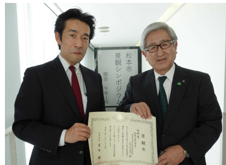
坪田副市長と記念撮影