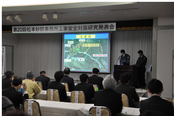
工事安全対策研究発表会

発表会には、工事関係者や工事を発注する行政機関を中心に約250名の方が参加し、砂防工事の安全に対する取り組みや工夫などを熱心に聞いていただきました。