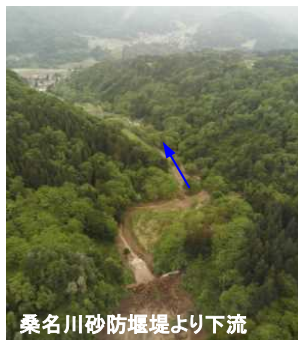
桑名川砂防堰堤より下流