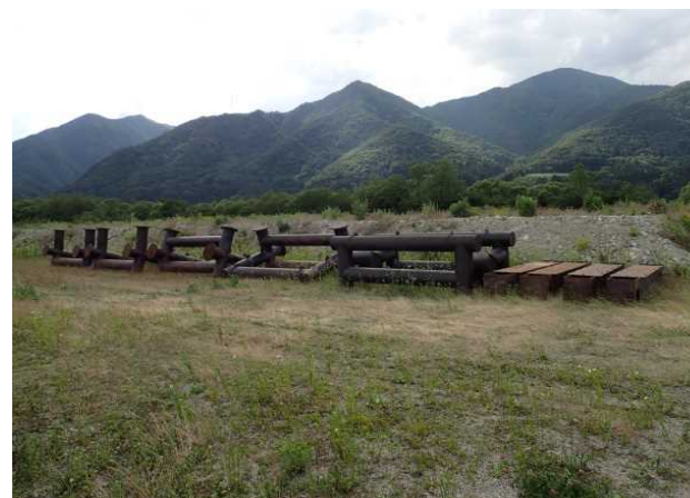
鋼製砂防牛柵水制（写真は2基分）