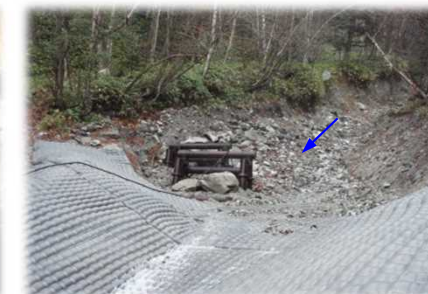
平成23年の産屋沢土石流災害時に、応急対応として使用しました。