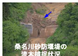
桑名川砂防堰堤の 流木捕捉状況