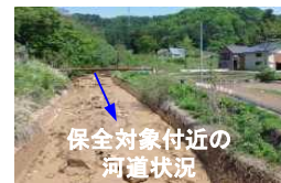
保全対象付近の 河道状況