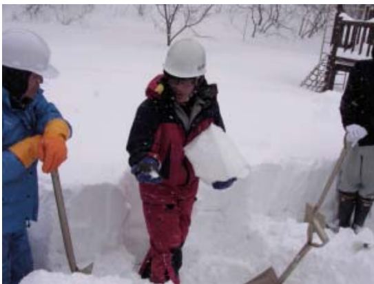
【断面観測による弱層判別】