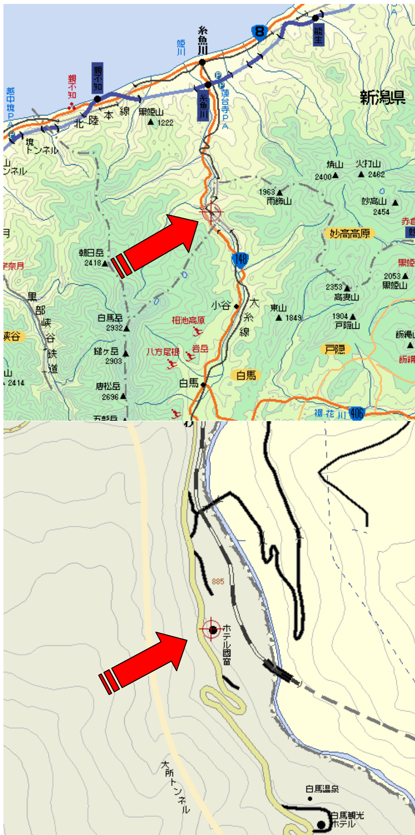
第4回雪崩対策講習会開催場所（ホテル国富 翠泉閣）