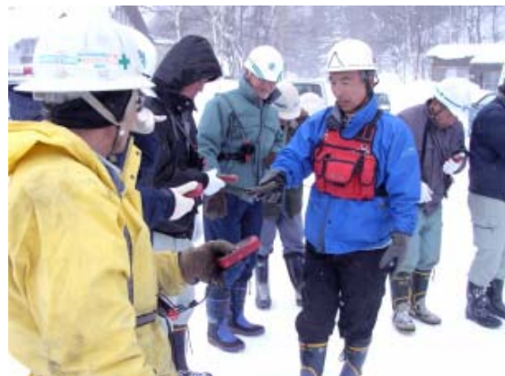
【ビーコンを用いた捜索方法】