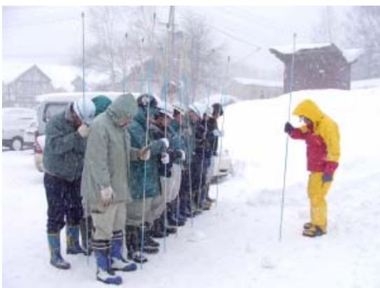
【ゾンデ棒を用いた捜索方法】