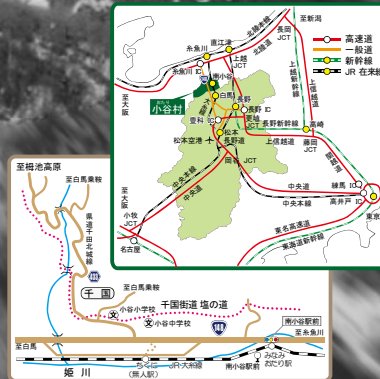
写真：稗田山源頭部崩壊地

【車でお越しの場合】 中央自動車道→長野自動車道 豊科ICより約60km 関越自動車道→上信越自動車道 長野ICより約55km 北陸自動車道→糸魚川ICより約40km 【JRでお越しの場合】 大糸線 南小谷駅下車 タクシー約5分またはバス約8分