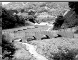
浦川スーパー暗渠堰堤