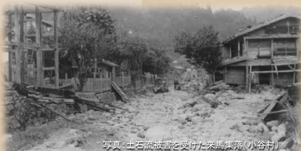
写真：土石流被害を受けた来馬集落(小谷村)