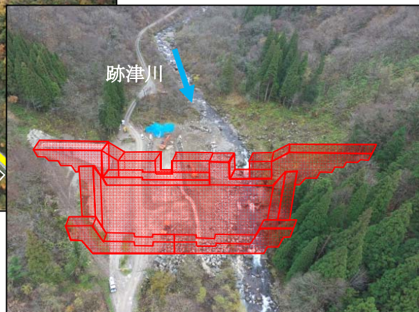
跡津川上流砂防堰堤