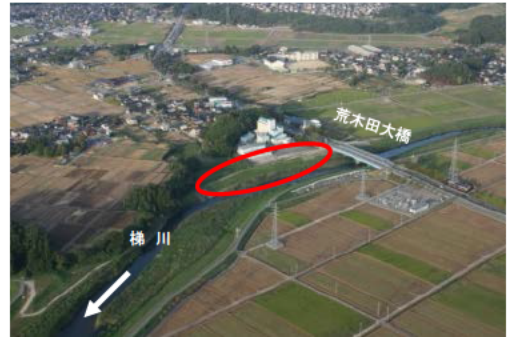
梯川 荒木田地区 堤防整備の推進(石川県)