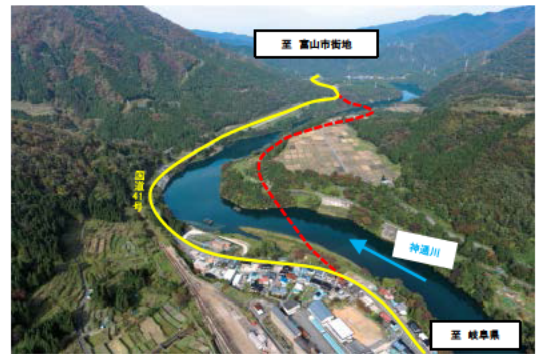
国道41号猪谷楡原道路(富山県)