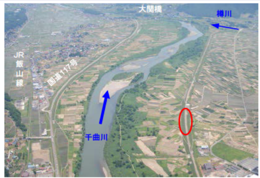
千曲川 木島地区 堤防浸透対策の推進(長野県)