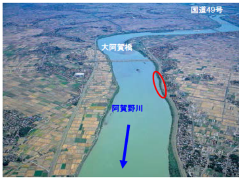
阿賀野川 小杉地区 堤防侵食対策の推進(新潟県)