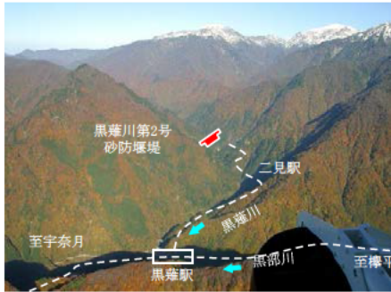
黒部川水系砂防 黒部川第2号砂防堰堤の整備推進(富山県)