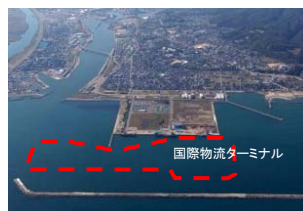
伏木富山港伏木地区 国際物流ターミナル整備事業(富山県)

安全・安心な暮らしと持続可能な経済社会の基盤確保のための港湾施設・海岸保全施設の整備を推進します。