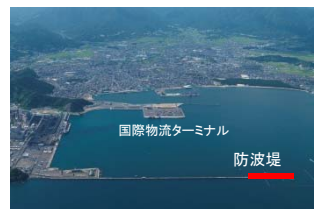
敦賀港鞠山南地区 国際物流ターミナル整備事業(福井県)