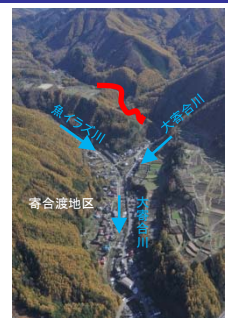
信濃川上流水系(砂防) 境川溪流保全工(長野県)