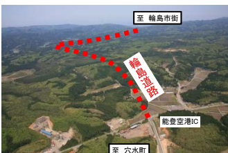
能越自動車道 輪島道路 (石川県)