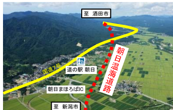
国道7号(日本海沿岸東北自動車道) 朝日温海道路(新潟県)