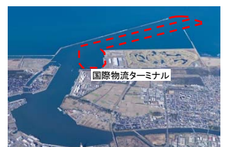
金沢港大野地区 国際物流ターミナル整備事業(石川県)