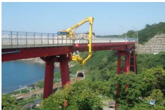
道路の老朽化対策 (橋梁点検)

道路の老朽化対策を重点的に実施するとともに、代替性確保のための道路ネットワーク整備や交通渋滞の緩和等を図るための事業を推進します。