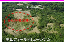
里山フィールドミュージアム