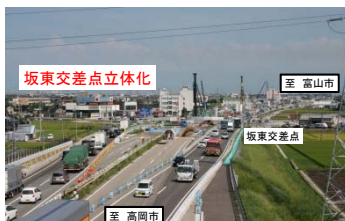
国道8号 富山高岡バイパス (富山県)