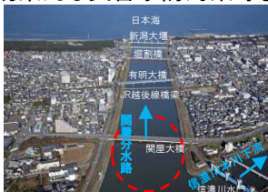
信濃川下流 関屋分水路地区 河川改修(新潟県)

災害が発生した地域において再度災害の防止対策、災害危険度の高い地域における効果的な災害予防対策等を推進します。