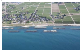
下新川海岸 第3工区:吉原地区 海岸保全施設整備(富山県)