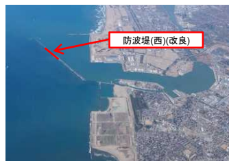
金沢港大野地区 防波堤改良事業(石川県)