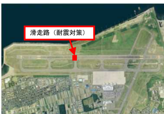
新潟空港耐震化事業(新潟県)