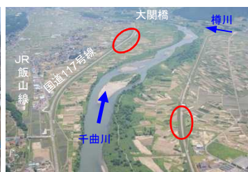
千曲川 木島・常盤地区 浸透対策の推進 (長野県)