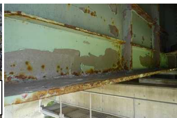
道路の老朽化対策