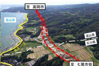
国道470号 能越自動車道 七尾水見道路 (富山県・石川県)