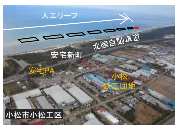
石川海岸 海岸保全施設の整備推進 (石川県)