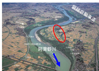
阿賀野川 六郷地区 浸透対策の推進 (新潟県)