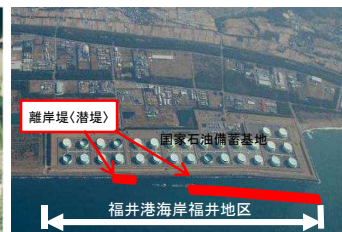
福井港海岸福井地区 海岸保全施設整備事業(福井県)