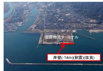
伏木富山港伏木地区 国際物流ターミナル整備事業(富山県)