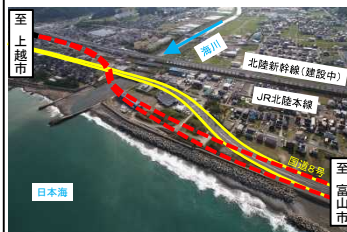
国道8号系魚川東バイパス(新潟県)