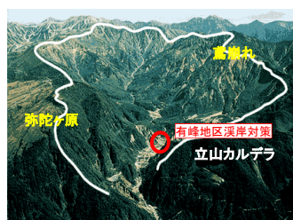
有峰地区溪岸対策の推進 (富山県)