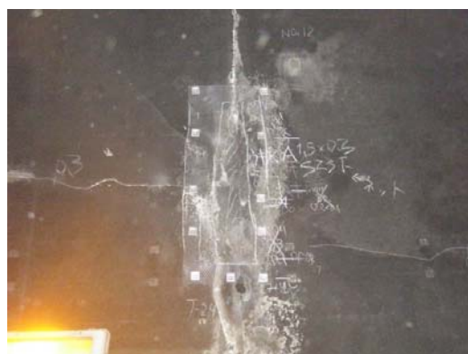
いがしま 五十島トンネル 壁面の補修