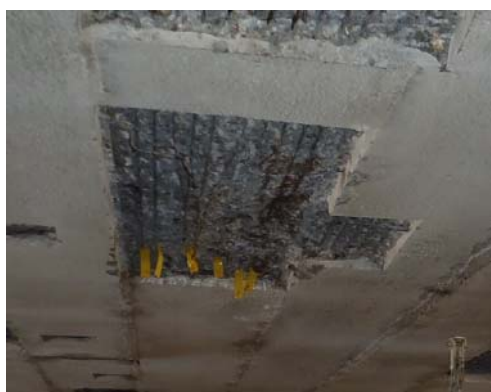
にごりすみかわばし 濁澄川橋 主桁の補修