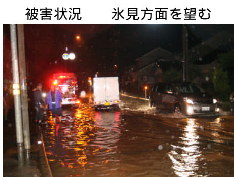
平成22年7月9日20時ごろ