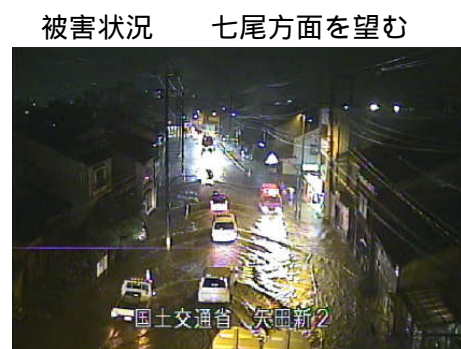
平成22年7月9日20時ごろ