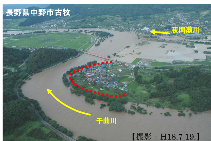
【撮影：H18.7.19.】 H18年7月梅雨前線豪雨 千曲川の出水状況