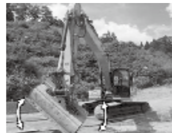
チルトバケット搭載型 MCバックホウ▶P.13