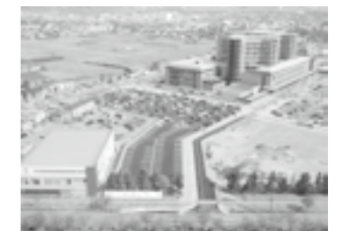
石川県立中央病院 (外構・造成工)▶P.23