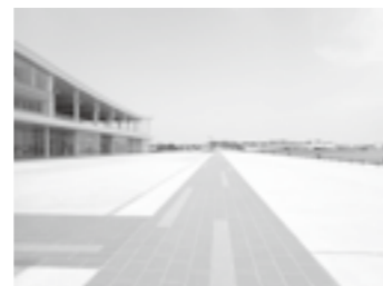
完成した歩行者用通路▶P.9