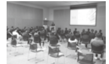
合同企業セミナーの状況▶P.17

※このロゴは平成30年6月1日に国土交通省が決定したロゴです。建設業界はもちろん、業界を超えて社会全体から応援される取り組みへと「深化」するシンボルとなっています。