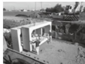
大型ボックスカルバート据付▶P.7