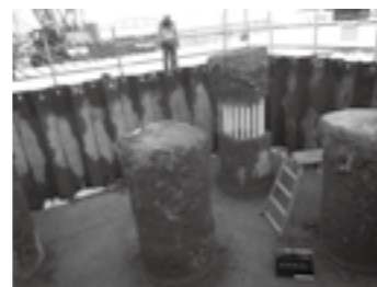
余盛りコンクリート引抜状況▶P.5