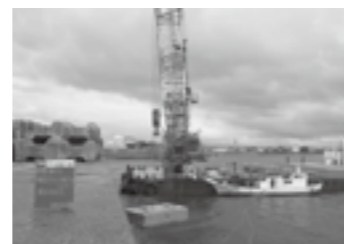
根固ブロックの据付状況▶P.3