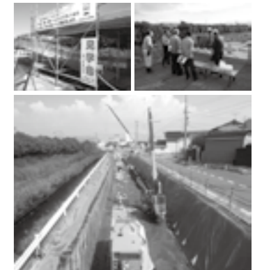
ノンステージング工法と見学台▶P.15