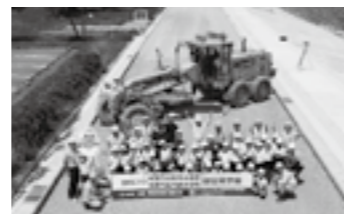
工事見学会(令和元年7月撮影)▶P.7