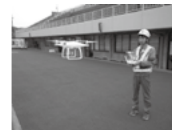
ドローンを操作している写真 西園 雄太さん▶P.24