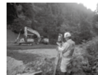
現場での測量状況 黒田 太一さん▶P.23