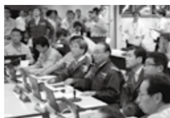
災害対策本部会議の開催状況▶P.3