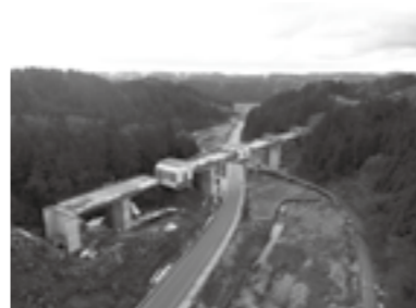
■国道470号能越自動車道 輪島道路 輪島道路は、(仮称)輪島IC~のと里山空港IC間の11.5kmを整備する事業です。 (仮称)三井IC~のと里山空港ICは、2022年夏までの開通を目指して工事を進めています。 写真は、現在建設中の小泉高架橋です。