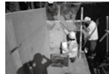
構造物の確認を行う▶P.24