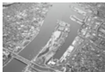
万代島地区を上空から望む▶P.5