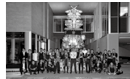
地元のお祭り「夜高祭り」の「行燈(あんどん)」を社屋の屋外スペースに設置、地元の皆さんと社内スタッフと一緒に記念撮影▶P.21