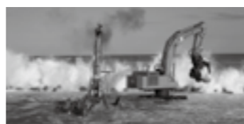
遠隔操縦式水陸両用大型バックホウ、水陸両用ブルドーザ▶P.11