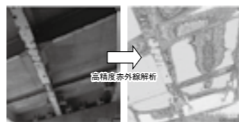
橋梁床版下面の高精度赤外線解析画像▶P.15