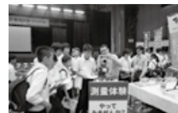
全国産業教育フェアプレ大会の状況▶P.17