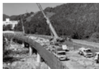
松川橋の床版取替▶P.7