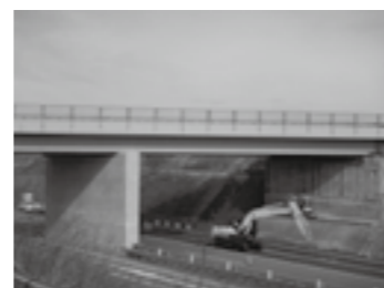
橋脚補強完了状況(美女野跨道橋、美女野水路橋)▶P.13