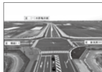
横越バイパス(平成30年4月部分供用) ▶P.5