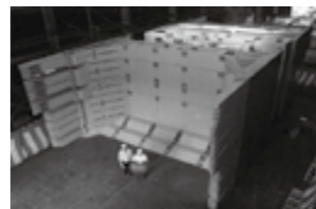
オープンシールド機全体▶P.7