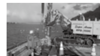
漁港施設の耐震強化工事の状況 ▶P.21