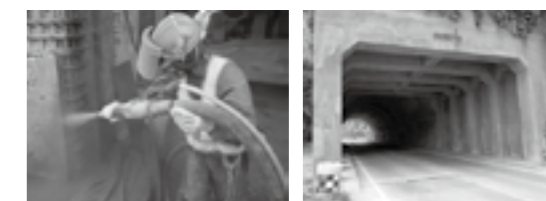
断面修復乾式吹付け工法▶P.22