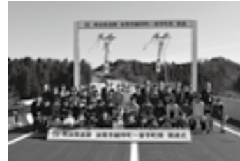
南加賀道路 細坪町～曾宇町 開通式▶P. 3