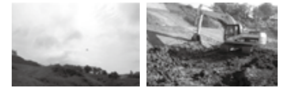
UAVによる3次元測量 ▶P.15 MGバックホウによる法面整形 ▶P.15