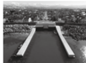
竣工した沖田川放水路河口部▶P. 5