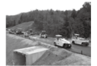
能越道 新設舗装工事▶P.17