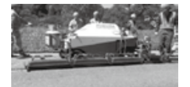
加熱式ジョイントクラック処理工法(ヒートドレッシングJr)▶P.18