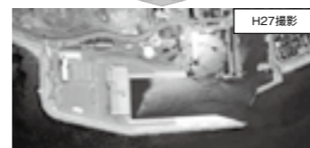
事業完成後の比較▶P.7