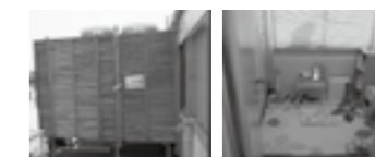
女性専用トイレ・女性休憩室 ▶P.15