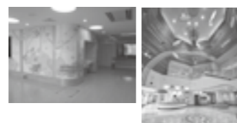
キャラクター等をデザインした「環境アート」▶P.3