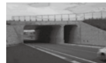
自分の設計した道路、 構造物が供用！▶P.17