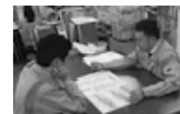
立案内容を社内で議論