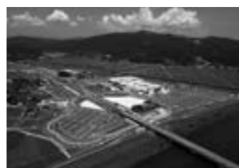
東部産業団地の全景▶P. 3

技術レポート 5 特殊橋梁の耐震補強事例 一般国道156号 湯出島橋における耐震補強について ■富山県砺波土木センター 7 H26梯川古府災害復旧その2工事 河川工事における情報化施工（3Dバックホウマシンガイダンス）事例 ■(株)丸西組 11 白山の甚之助谷地すべり対策排水トンネル工事の概要 標高2000mでのトンネル工事 ■飛鳥建設(株) 15 地すべり防止区域の土石流対策 土石流堆積工の計画 ■(株)東洋設計