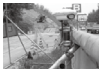
現場内に固定局が不要▶P. 7