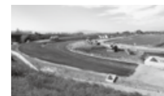
高岡砺波スマートIC施工の様子▶P.22

「北陸の建設技術」への意見、ご感想がありましたらお聞かせください。 E-mail:hokugi@hrr.mlit.go.jp