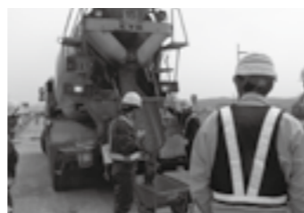
1 DAYコンクリート搬入 ▶ P. 5