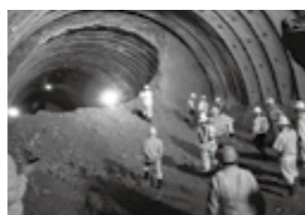
八箇峠トンネル(貫通時) ▶ P.17