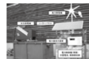
「でんげんさん」システム構成 ▶ P.23