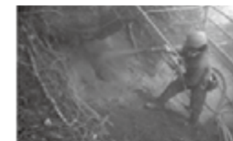
長距離圧送モルタル吹付「キロ・フケール工法」 ▶ P.23