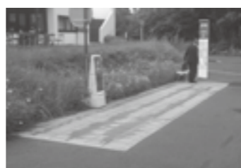
バス停への適用例 ▶ P. 9