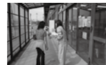
県民に土砂災害防止の啓発活動を行っている様子 ▶ P.19