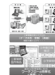
「維持JV 情報共有システム」 新技術説明図 ▶ P.24

「北陸の建設技術」への意見、ご感想がありましたらお聞かせください。 E-mail:hokugi@hrr.mlit.go.jp