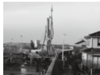
民家に近接しての施工 ▶ P.53