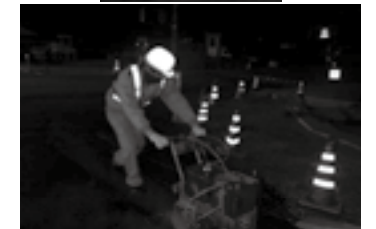
全面反射ヘルメット ▶ P.63