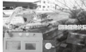
振動測定状況 ▶ P.51