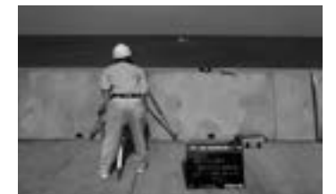
人工リーフの高さを確認している様子 ▶ P.61