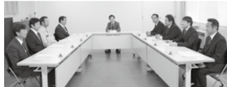
優良建設技術者座談会 ▶ P.35