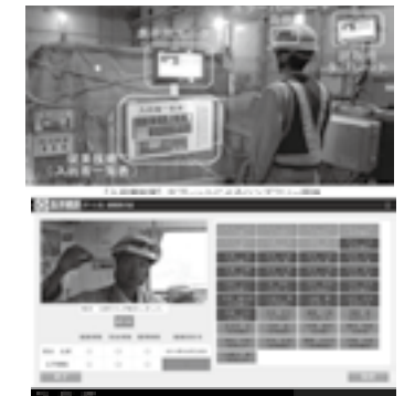
Color Gate System ～動作管理システム～ ▶ P.63

「北陸の建設技術」への意見、ご感想がありましたらお聞かせください。 E-mail:hokugi@hrr.mlit.go.jp