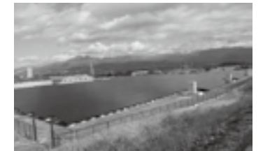
メガソーラー発電施設工事への取り組み ▶ P.59