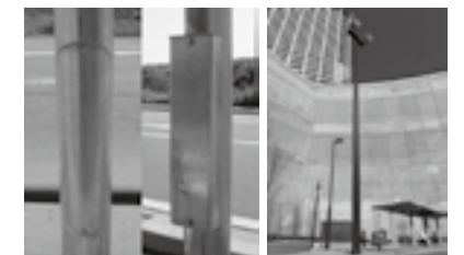
新技術(左)と従来技術(右)の比較 新技術の施工実績 ▶ P.19