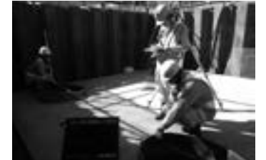
既製杭工の段階確認を受けている 長谷川 竜太さん (写真手前) ▶ P.17