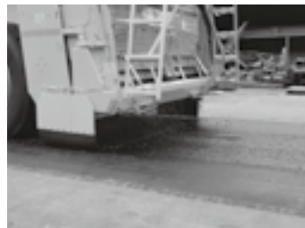
プレコートチップ散布状況 ▶ P. 9