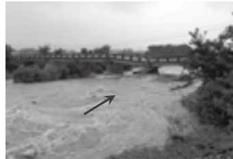
被災直後の状況 (右岸上流側から) ▶ P. 5