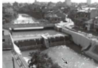
小橋用水堰 (鋼製起伏ゲート2門： 純径間 15.9m× 扉高 3.9m) ▶ P. 7