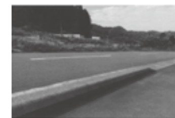
目地バリシート施工後▶ P.21