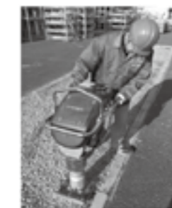
高打撃ランマ締め風景▶ P.21

「北陸の建設技術」への意見、ご感想がありましたらお聞かせください。 E-mail:hokugi@hrr.mlit.go.jp