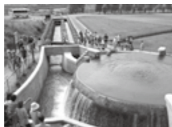
見学の様子(東山円筒分水槽)▶ P. 7