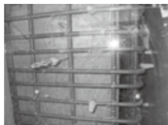
透明型枠▶ P. 9