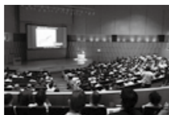
基調講演の聴講状況(第1会場)▶ P. 3