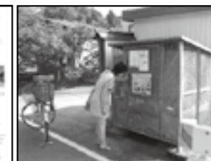
作成した大島組かわらばん▶ P.17