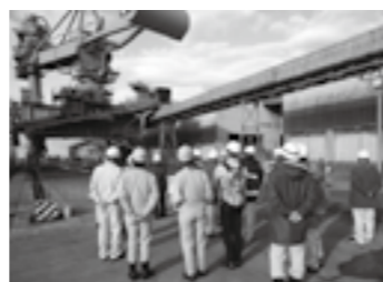
見学会(明星セメント)▶ P.15