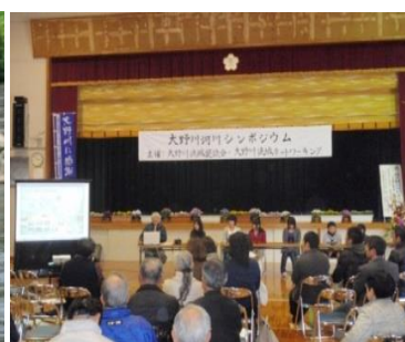
シンポジウムの開催