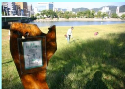
市民団体による看板設置事例（太田川）