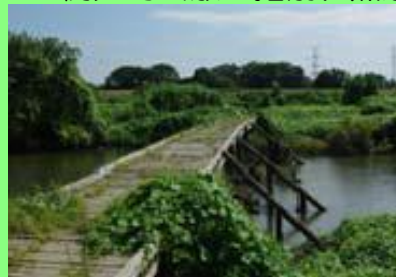
ビオトープの整備