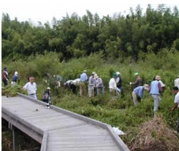
ビオトープの整備