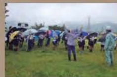
黒部市立宇奈月小学校