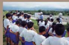
入善町立飯野小学校