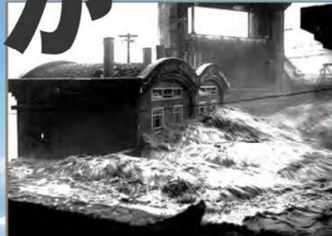
昭和27年7月洪水(愛本堰堤管理棟に流れ込む濁水)

会場 黒部市国際文化センター コラーレ 黒部市三日市20 Tel.0765-57-1201