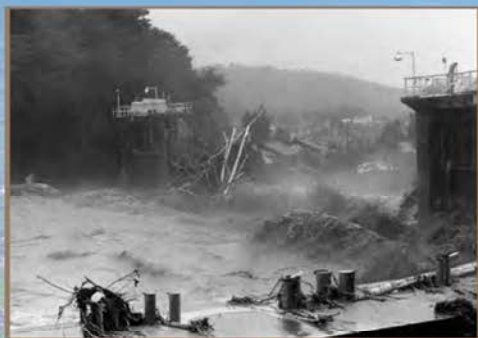
昭和44年8月洪水(愛本橋流出)