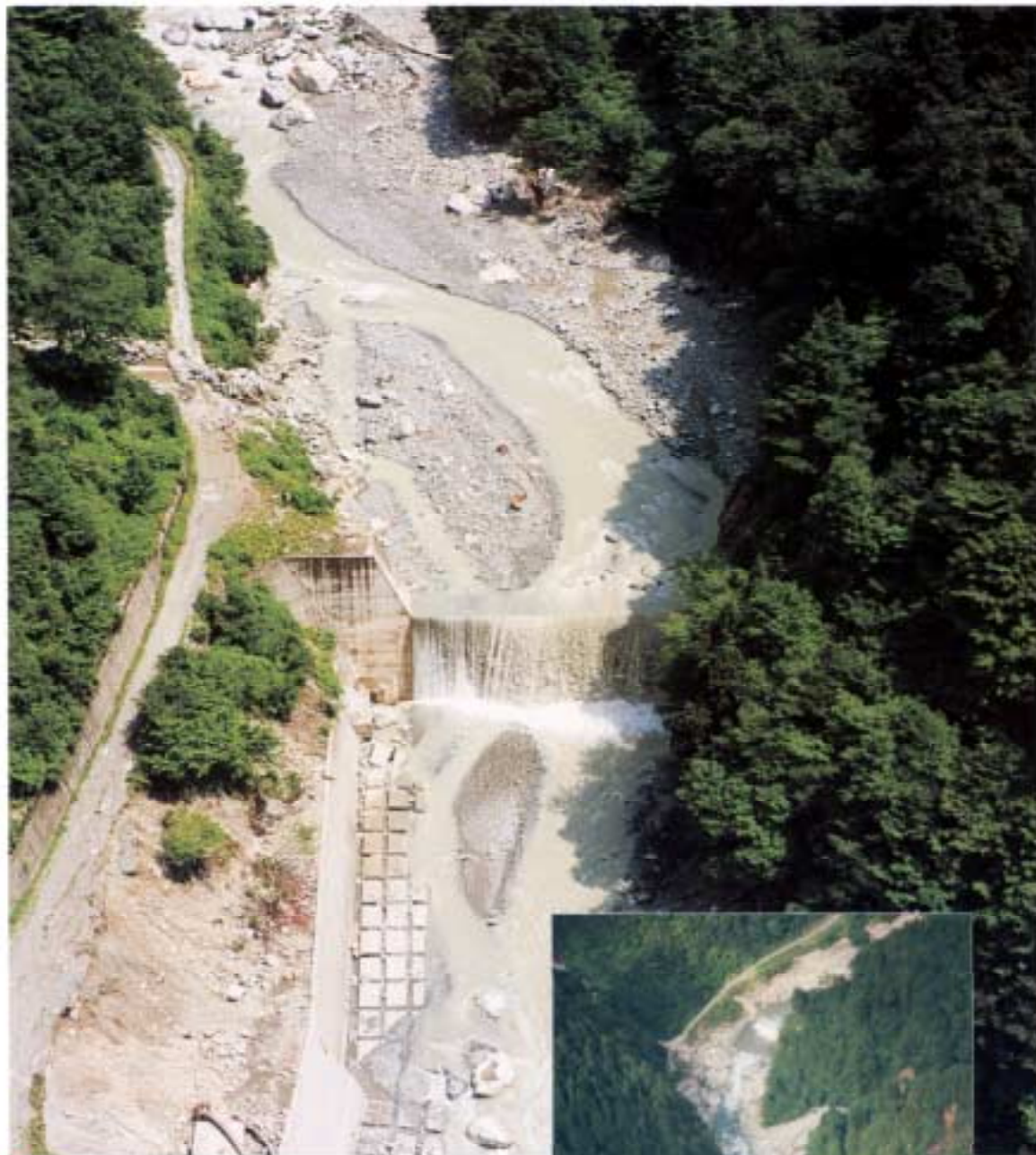
●黒部川第1号砂防ダム