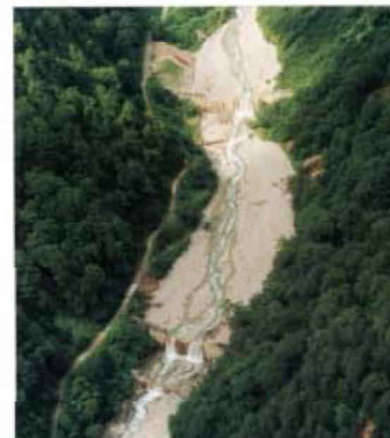
●祖母谷第2号砂防ダムと第3号砂防ダム

豪雨によって、黒部川上流の河川は甚大な被害を受けた。しかし、すでに砂防施設による整備が進められていた黒部川および祖母谷では、砂防ダムがその機能を十分に発揮。土砂の移動を抑え、出水や増水などの被害を最小限に食い止めた。砂防事業の効力と必要性が、この7月豪雨災害で改めて証明された。