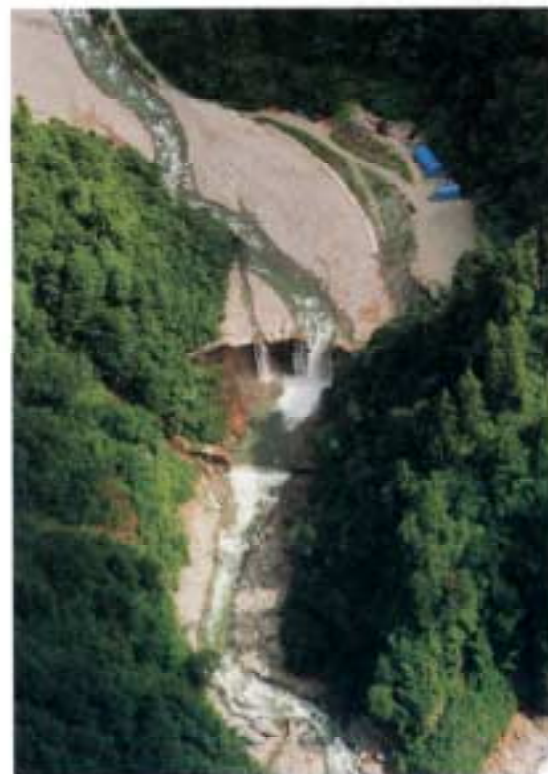
●祖母谷第1号砂防ダム