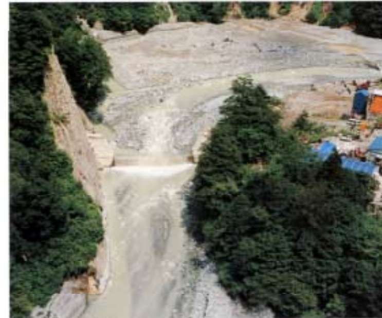
●黒部川第3号砂防ダム