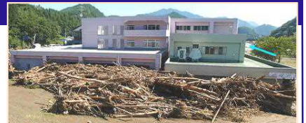
平成28年台風10号により、岩手県の要配慮者利用施設では利用者9名の全員が死亡。