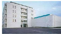
新館の会場の様子