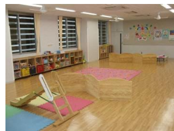
現在の地域子育て支援センター