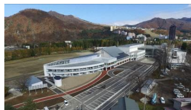
完成した小中一体型校舎・認定こども園

町内4つの保育園を統合した認定こども園と総合子育て支援センターの整備により、多様な保育サービスの提供やよりきめ細やかな子育て支援が可能となった。