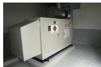
非常用自家発電設備

さらに、教育構想の具体化に向け平成22年5月に一般公募町民や保育園・小中学校の保護者、学識経験者、小中学校長、行政職員で構成する文教施設整備委員会を立ち上げ、教育・保育・建設の三分科会において検討を行い、「湯沢町統合文教施設検討結果報告書」をまとめた（平成23年2月）。また、その内容を地域へ説明した。