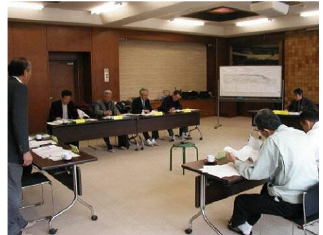
土樽自然公園検討会