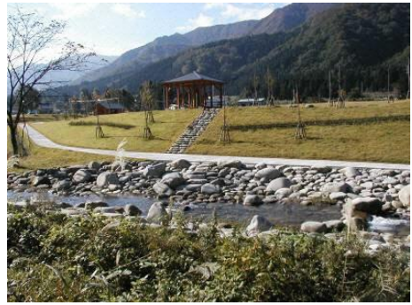
一部供用開始された土樽自然公園

都市マスタープランにおけるアンケート調査（土樽西地域）では、町の目指すべき方向として「観光と保全」、地域のまちづくりの方向として「自然環境と景観を活かしたまちの形成」が望まれているが、他の地域に比べて観光施設が少なく恵まれた地域資源が活かされていない。