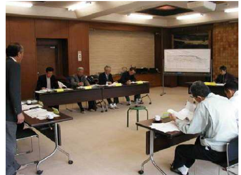
土樽自然公園検討会