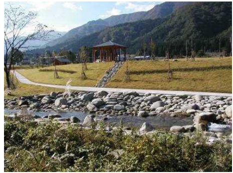
一部供用開始された土樽自然公園

都市マスタープランにおけるアンケート調査（土樽西地域）では、町の目指すべき方向として「観光と保全」、地域のまちづくりの方向として「自然環境と景観を活かしたまちの形成」が望まれているが、他の地域に比べて観光施設が少なく恵まれた地域資源が活かされていない。